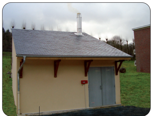
La chaufferie bois

Les logements sont répartis en quatre bâtiments, initialement chauffés par deux chaufferies indépendantes au fioul domestique. Aucune des deux chaufferies ne pouvant accueillir une chaudière bois et un silo de stockage, une nouvelle chaufferie a été construite. Située à une trentaine de mètres de l'immeuble le plus proche, la nouvelle chaufferie est équipée d' une chaudière bois de 200 kW, dimensionnée pour couvrir 90 % des besoins de chauffage des logements, un appoint-secours au fioul domestique étant conservé dans l'une des deux chaufferies existantes.