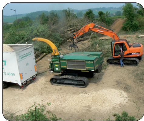
Chantier de production de plaquettes

En choisissant de confier l'approvisionnement de sa chaufferie à la Coopérative Forestière de Rouen, à l'entreprise Environnement Forêts et à un groupement d'exploitants agricoles fédérés grâce aux associations Défis Ruraux et EDEN, SODINEUF Habitat Normand a souhaité privilégier un approvisionnement de proximité issu de l'entretien des forêts et des haies, contribuant ainsi à la pérennisation, voire à la reconquête des espaces boisés du Pays de Bray.