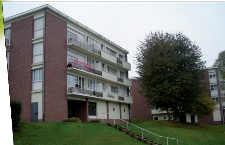
La Résidence du Vallon de la Haye

L'absence de réseau de distribution de gaz naturel sur la commune de Saint-Saëns, le souhait de limiter la facture énergétique des locataires sociaux et la proximité des importants gisements forestiers et bocagers du Pays de Bray ont poussé SODINEUF à envisager de construire une chaufferie au bois déchiqueté qui a été mise en service en janvier 2009.