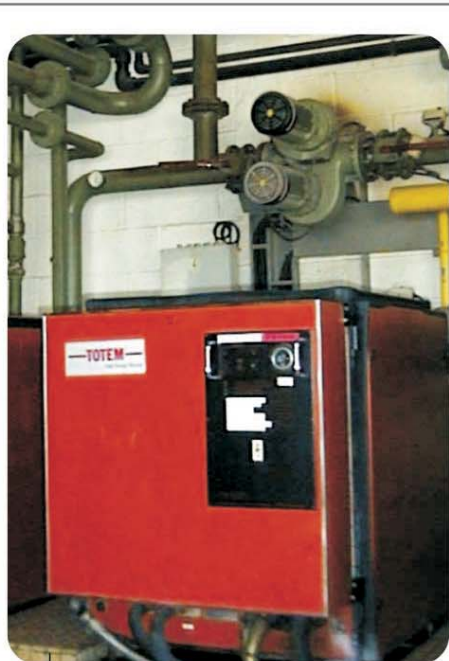
Un groupe moteur

Dans la perspective d'une valorisation en agriculture, ce procédé permet d'améliorer l'intérêt des boues : réduction des odeurs, élimination d'une partie des composés organiques volatils, précipitation des métaux lourds ainsi moins facilement assimilables par la plante.