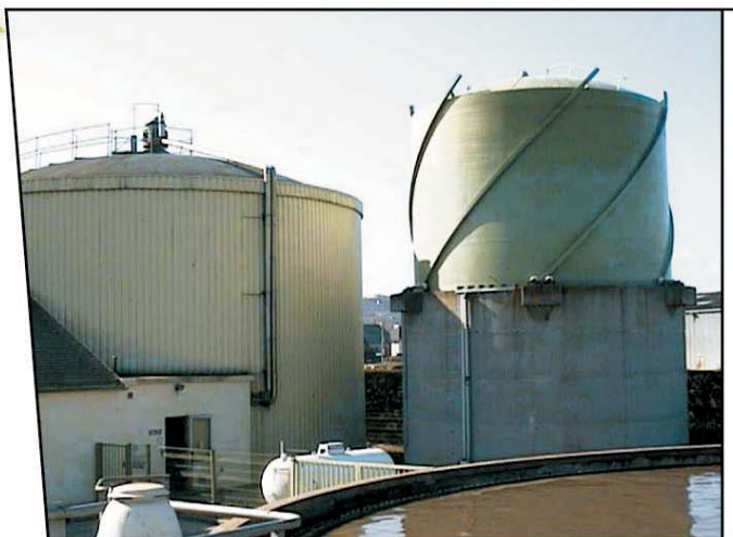
Le digesteur et le gazomètre

Le biogaz émanant de cette réaction biologique est transformé en électricité et en chaleur. 28 % des besoins électriques et l'intégralité des besoins en chaleur sont ainsi couverts. Il est récemment apparu que l'outil avait un autre intérêt : il permet de réduire de 40 % le flux des boues d'épuration désormais dirigées vers le centre d'enfouissement technique de Mézerolles, près de Laval (53).