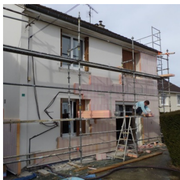
Mise en œuvre de l'isolation par l'extérieur - Mars 2013