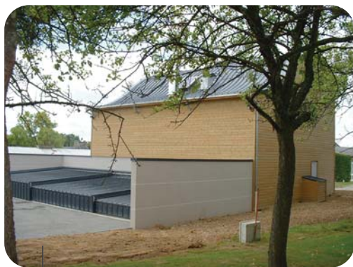
La chaufferie et son silo

Dans le cadre d'une restructuration de ses locaux, le Centre hospitalier a opté pour une démarche "Haute Qualité Environnementale" . Celle-ci a abouti à proposer des bâtiments plus économes (+ 20 % de besoins pour une augmentation des surfaces chauffées de 50 %) et à retenir le bois comme source d'énergie principale pour la production de chauffage et d'eau chaude sanitaire du site.