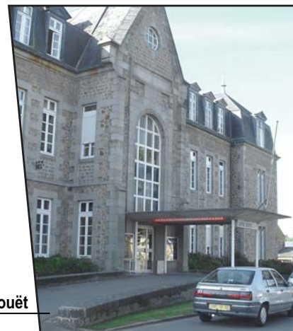
L'hôpital de Saint-Hilaire-du-Harcouët

A l'occasion de la rénovation du système de production d'énergie thermique de l'établissement, le centre hospitalier a choisi de mettre en place une chaufferie centrale bois/gaz et a proposé aux lycées technique et professionnel Claude Lehec de se raccorder à la chaufferie bois, pour la fourniture d'une partie de leurs besoins d'énergie.