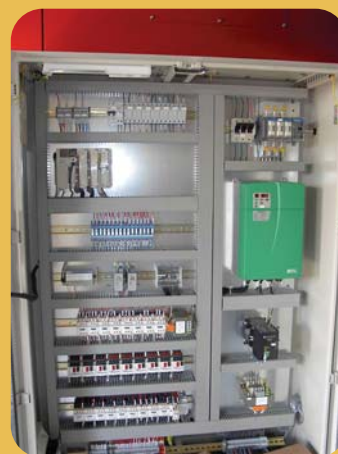
L'armoire de commande

Un modem de communication et une ligne téléphonique relie l'installation au siège du constructeur. Ce service permet de maintenir une relation directe avec des techniciens spécialisés, ceux-ci ayant la possibilité d'analyser à distance les éventuels dysfonctionnements de la chaufferie bois, de faire des réglages et d'apporter des conseils au personnel de l'hôpital.