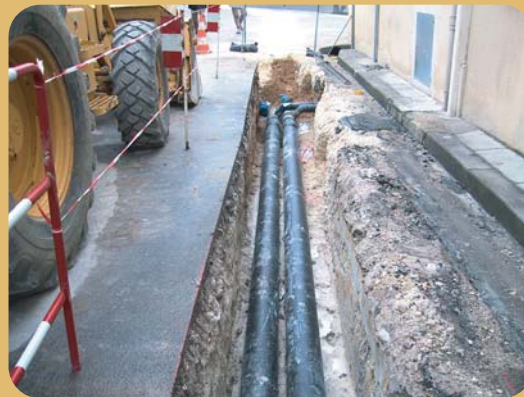
Canalisations enterrées

Cependant, pour les petits réseaux, le Code général des impôts permet une simplification de la facturation aux usagers : en deçà d'un montant de recettes de vente de chaleur de 76 200 €/an, la collectivité peut opter pour le non-assujettissement à la TVA, ce qui aboutit à réduire la facture des usagers de près de 20 %. A contrario, la collectivité ne récupère pas la TVA sur les investissements, ce qui majore d'autant le coût des travaux à sa charge.