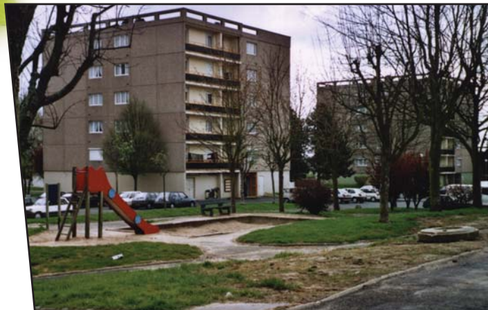
Les logements HLM du quartier d'Argouges

Dans le cadre d'un programme de rénovation, l'Office public a opté pour une chaufferie centrale au bois et un réseau de distribution de la chaleur desservant trois de ses ensembles locatifs (470 logements) dans le quartier d'Argouges à Bayeux. Le lycée voisin Arcisse de Caumont est également client du réseau de chaleur, concédé pour 24 ans à la société DALKIA.