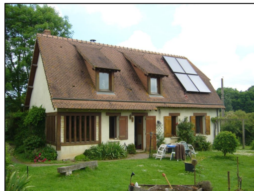
Panneau solaire thermique à usage domestique

Après une baisse du nombre d'installations aidées entre 2007 et 2008, l'évolution du parc est repartie à la hausse entre 2008 et 2009, avec une progression de 11 % pour les CESI et 25 % pour les SSC (en nombre d'installations).