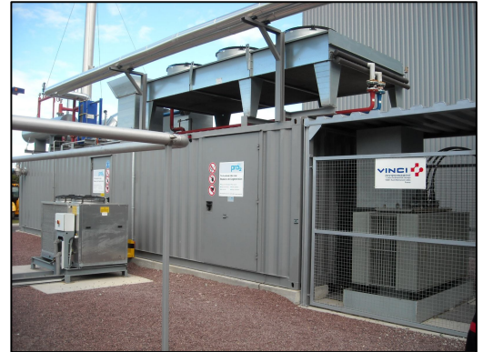
Moteurs de l'installation de méthanisation du Point-Fort (50)

Les maîtres d'ouvrage de ces installations bénéficient d'une obligation d'achat de l'électricité produite et profitent d'une chaleur disponible sur site. Les installations peuvent par ailleurs bénéficier d'aides à l'investissement. Citons également la production des décharges, qui récupèrent le biogaz sur site en vue, soit d'une élimination en torchères, soit d'une valorisation en chaleur.