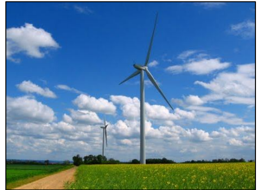
Parc éolien de Fierville-Bray (communes de Fierville-Bray, Condé-sur-Ifs, Airan et Vieux-Fumé – 14 – 28 MW) mis en service mi-2009

La puissance installée a doublé entre 2008 et 2009 , et la production a progressé de plus de 60 % sur la période (la plupart des parcs installés en 2009 ont été mis en service en cours d'année ; la production 2009 ne correspond donc pas à une production pleine annuelle). Plusieurs parcs en cours de construction ou en phase finale d'instruction devraient être mis en service en 2010, ce qui contribuera à poursuivre la progression observée depuis 2004.