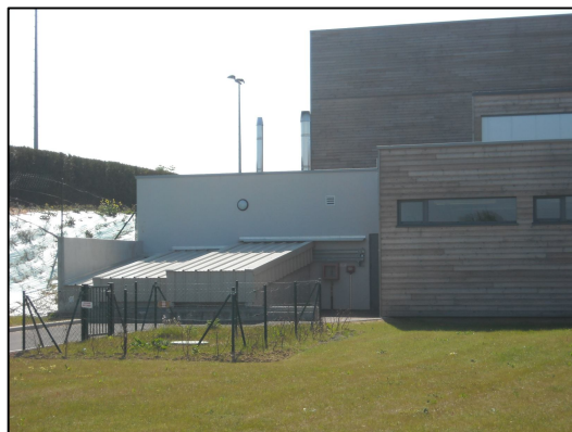
Chaufferie au bois déchiqueté du gymnase de Fontaine-Etoupefour mise en service en octobre 2009 (14 – 110 kW)

Les maîtres d'ouvrage peuvent bénéficier du soutien financier de la Région, de l'ADEME et de l'Europe dans la mise en œuvre des projets.