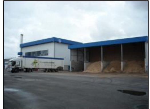
Chaufferie vapeur au bois déchiqueté de l'usine d'Isigny Sainte-Mère à Isigny-sur-Mer, mise en service en janvier 2008 (14 – 15,6 MW)

A ces deux dossiers, il convient d'ajouter, compte tenu de son importance, celui d'AREVA à la Hague (50) , qui prévoit une substitution très importante de fioul lourd actuellement utilisé pour produire de la vapeur, par une quantité de l'ordre de 150 000 tonnes de bois par an ; cette opération devrait être présentée dans le cadre de l'appel à projets BCIAT de 2010.