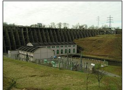
Barrage du Vézins (commune de Saint-Laurent-de-Terregatte – 50 – 13,5 MW)

A cette échéance, la production régionale d'électricité devrait donc chuter fortement.