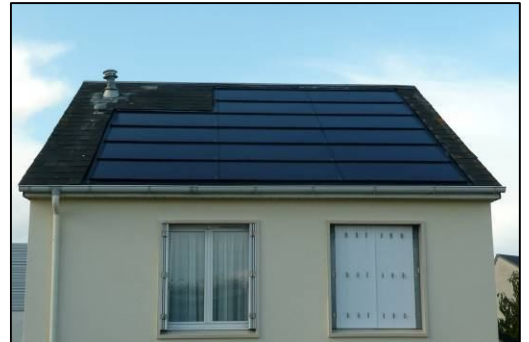
Panneau solaire photovoltaïque installé chez un particulier

Cette progression rapide pourrait être freinée en 2010 du fait de l'arrêt du dispositif d'aide régional.