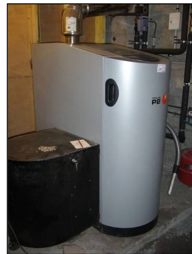
Chaudière automatique aux granulés de 25 kW

Malgré une forte baisse du prix du gaz en avril 2009, le parc d'installations de chauffage domestique au bois a continué de progresser, grâce notamment aux aides publiques et incitations fiscales. Les hausses du cours des énergies fossiles prévues en 2010 contribueront à maintenir un grand dynamisme dans le développement du chauffage domestique au bois.