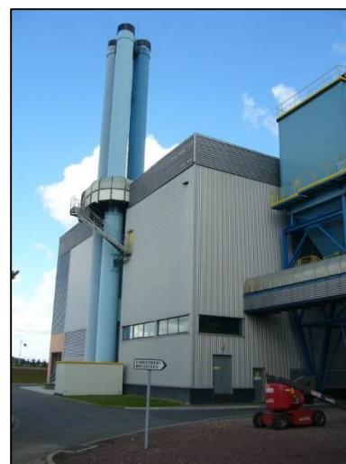
Unité de Valorisation Energétique du SIRAC à Colombelles (14)