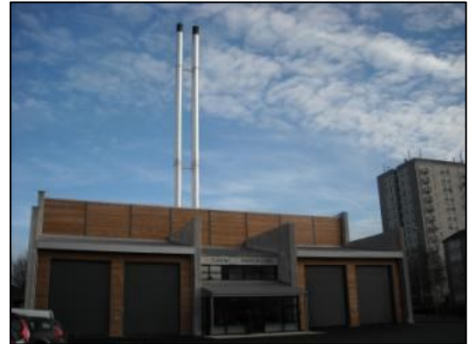
Chaufferie au bois déchiqueté du réseau de chaleur d'Argentan mise en service en décembre 2008 (61 – 7,6 MW)

Les maîtres d'ouvrage peuvent bénéficier du soutien financier de la Région, de l'ADEME et de l'Europe dans la mise en œuvre des projets.