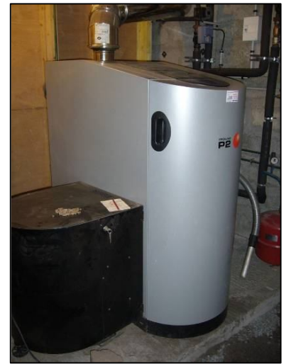
Chaudière automatique aux granulés de 25 kW

Le contexte énergétique (augmentations du prix du gaz programmées pour 2008) et le maintien des incitations fiscales et des aides régionales devraient contribuer à maintenir un grand dynamisme dans le développement du chauffage domestique au bois.