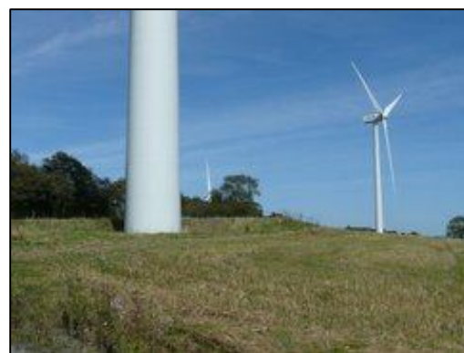
Parc éolien du Hamel au Brun (commune de Guilberville – 50 – 8 MW) mis en service en mars 2008

La Basse-Normandie dispose du deuxième potentiel éolien français derrière la Bretagne. C'est donc une filière qui sera probablement amenée à se développer de façon importante dans les années à venir, sur terre comme en mer (offshore).