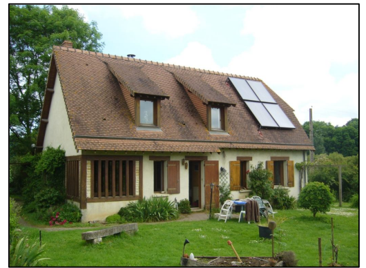
Panneau solaire thermique à usage domestique

Ces deux types d'équipements sont installés chez des particuliers, des professionnels ou sur le patrimoine des collectivités.