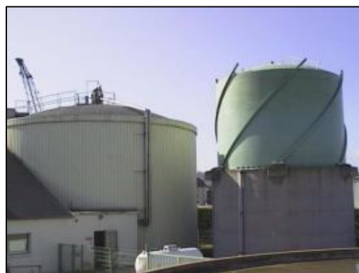
Digesteur et gazomètre de l'installation de méthanisation de Tourlaville (50)

Les maîtres d'ouvrage de ces installations bénéficient d'une obligation d'achat de l'électricité produite et profitent d'une chaleur disponible sur site. Les installations peuvent par ailleurs bénéficier d'aides à l'investissement définies au cas par cas à l'échelle régionale.