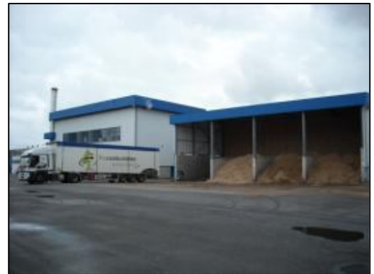
Chaufferie vapeur au bois déchiqueté de l'usine d'Isigny Sainte-Mère à Isigny-sur-Mer, mise en service en janvier 2008 (14 – 15,6 MW)