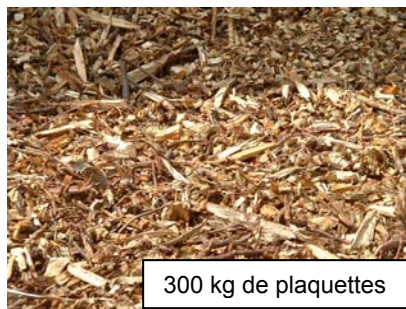
300 kg de plaquettes