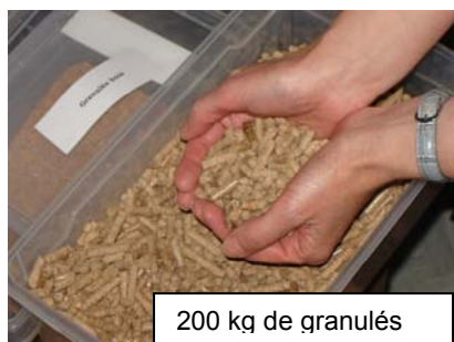
200 kg de granulés