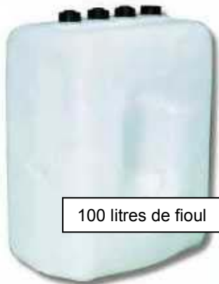
100 litres de fioul