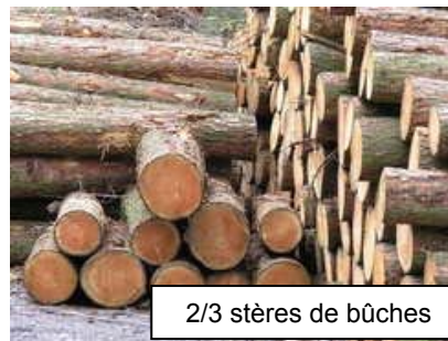
2/3 stères de bûches