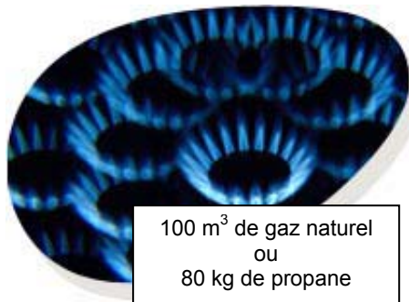
100 m 3 de gaz naturel ou 80 kg de propane